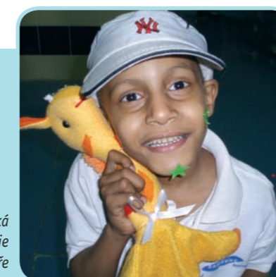
Dětská onkologie v Mansouře

mladých lidí podpořených z programu Mládež v akci: www.mladezvacki.cz/publikace .