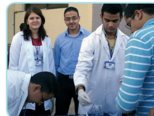
Nábor studentů do registru bezplatných dárců krve a krevní testy

mladých lidí podpořených z programu Mládež v akci: www.mladezvacki.cz/publikace .